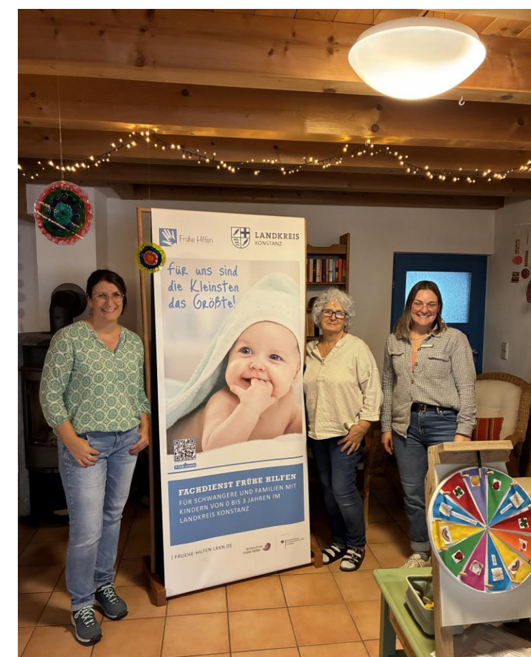
Bild 3 und 4. Mobile Frühe Hilfen Aktionstag am 10. Oktober 2025 am Kinder- und Spielzeugmarkt in Moos.