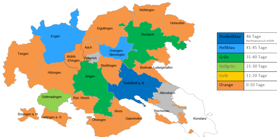
Abbildung 2: Betreuungszeiten während der Ferien – anspruchserfüllende Tage, Datenquelle: GaFÖG-Datenerhebung im Landkreis Konstanz 2025

Von den Kommunen, die den Rechtsanspruch in den Ferienzeiten (noch) nicht erfüllten, boten 5 Kommunen eine Betreuung an mindestens 41 Ferientagen an. Nur 5 Kommunen boten überhaupt keine Ferienbetreuung an.