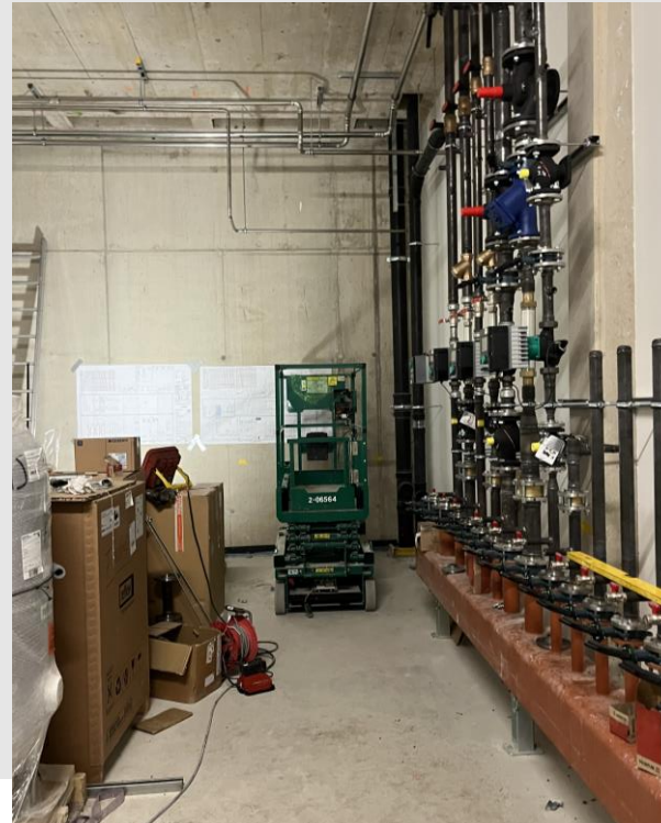
GT1 TGA-Installationen Technikräume