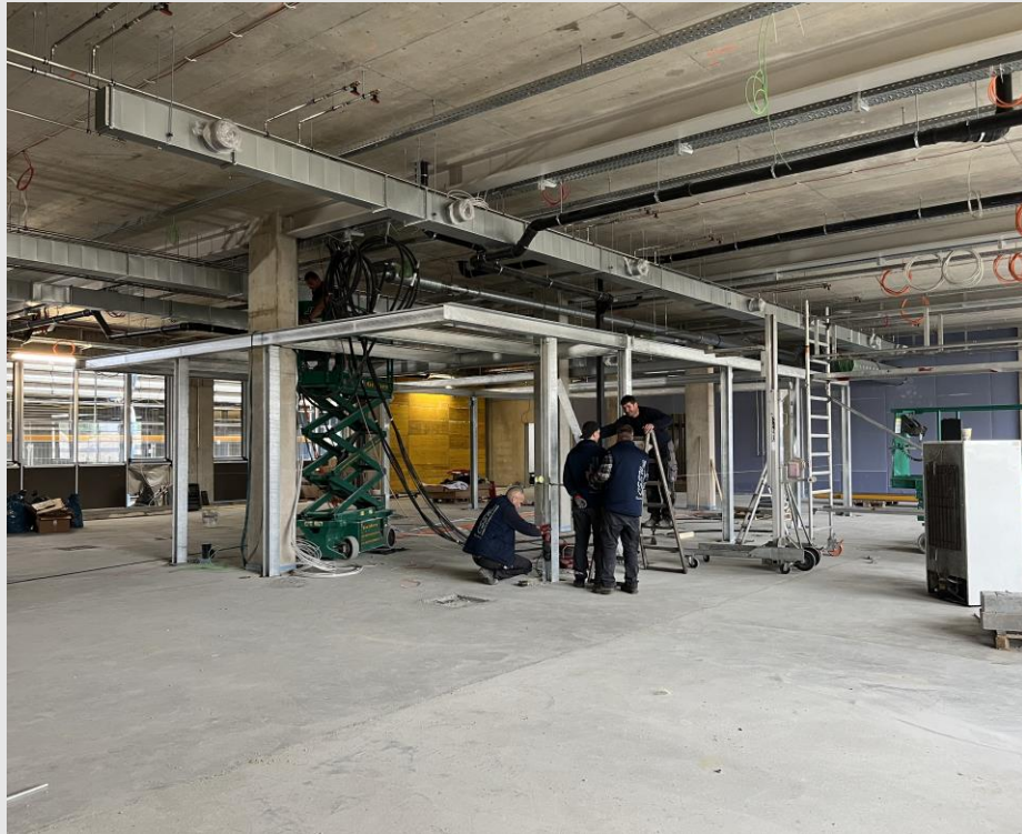
GT1 Erdgeschoss Montage Boxen