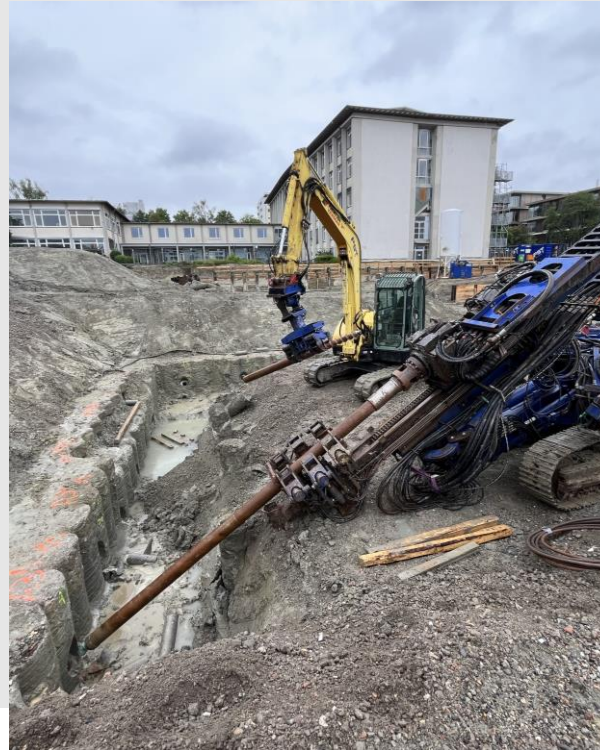
ZG Spezialtiefbau Rückverankerungen