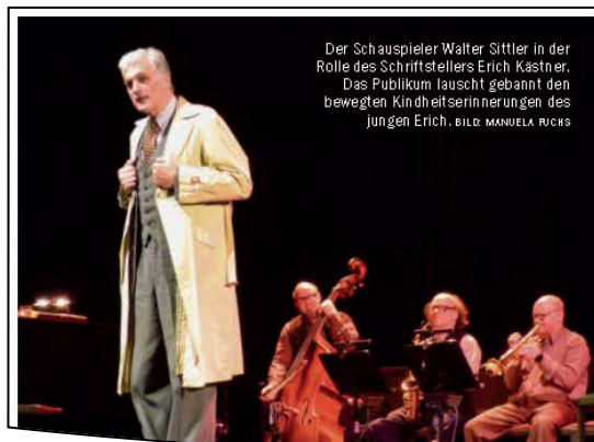
Der Schauspieler Walter Sittler in der Rolle des Schriftstellers Erich Kästner. Das Publikum lauscht gebannt den bewegten Kindheitserinnerungen des Jungen Erich.