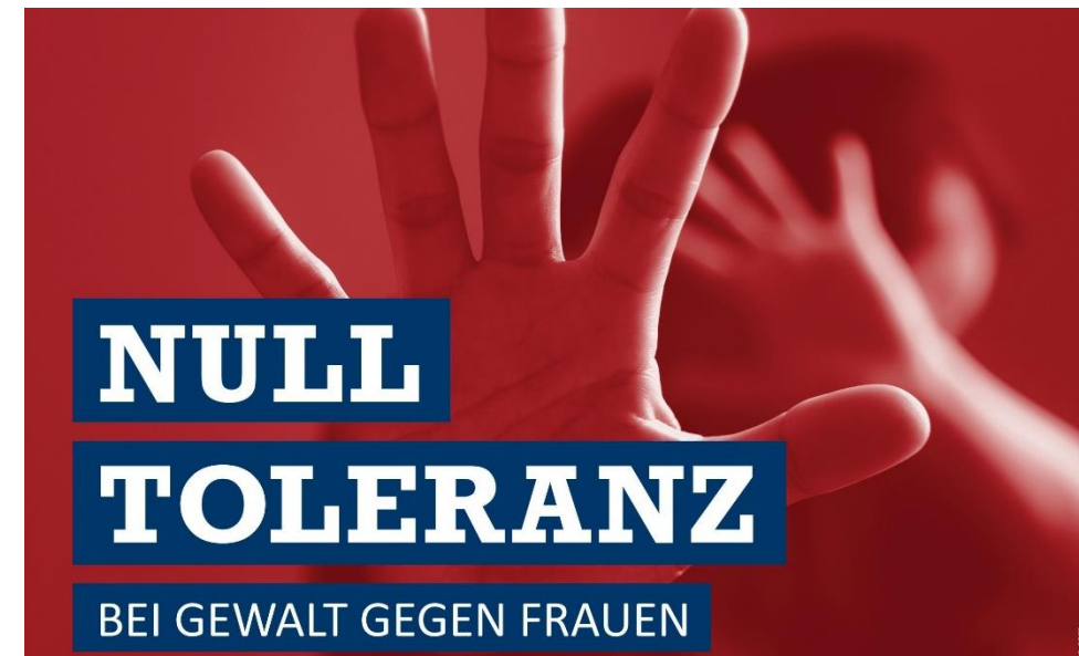
Plakatmotiv „Null Toleranz bei Gewalt gegen Frauen-Hinschauen statt wegschauen“