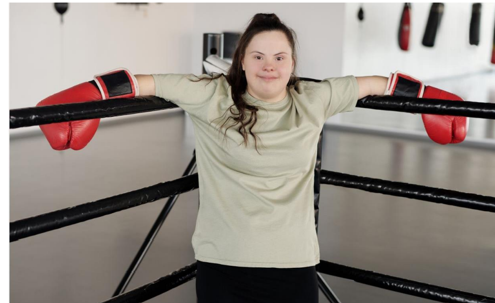
Coverbild Projekt „Frauen Stärken!“