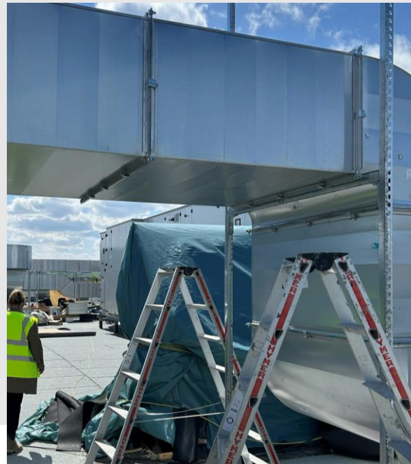
ZG: TGA-Montage auf dem Dach