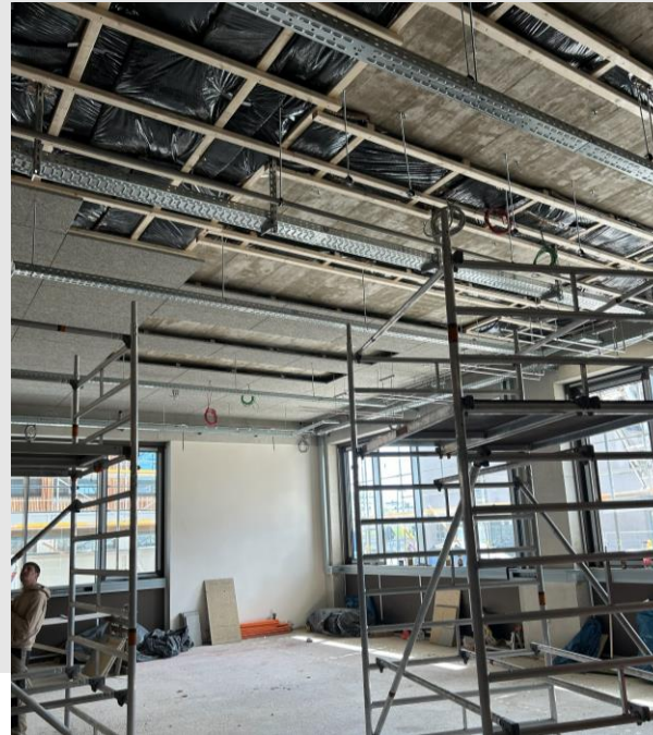
GT2: Montage abgehängte Decke