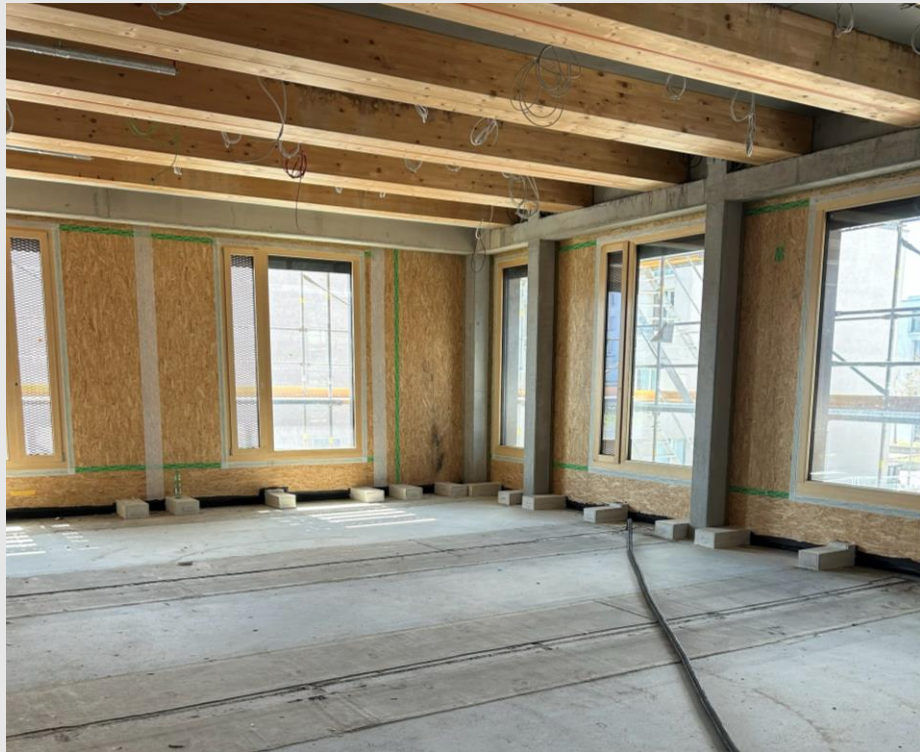
ZG: Trocknung HBV-Decken