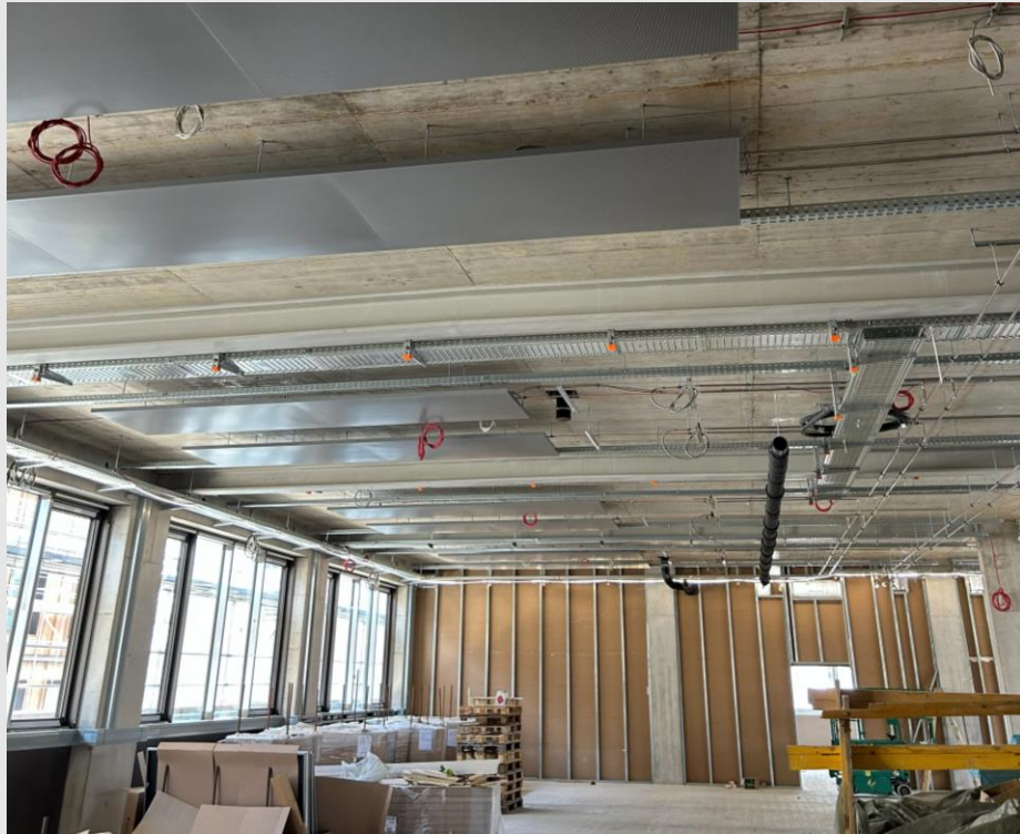
GT2: montierte Heizsegel, gestellte Trockenbauwände