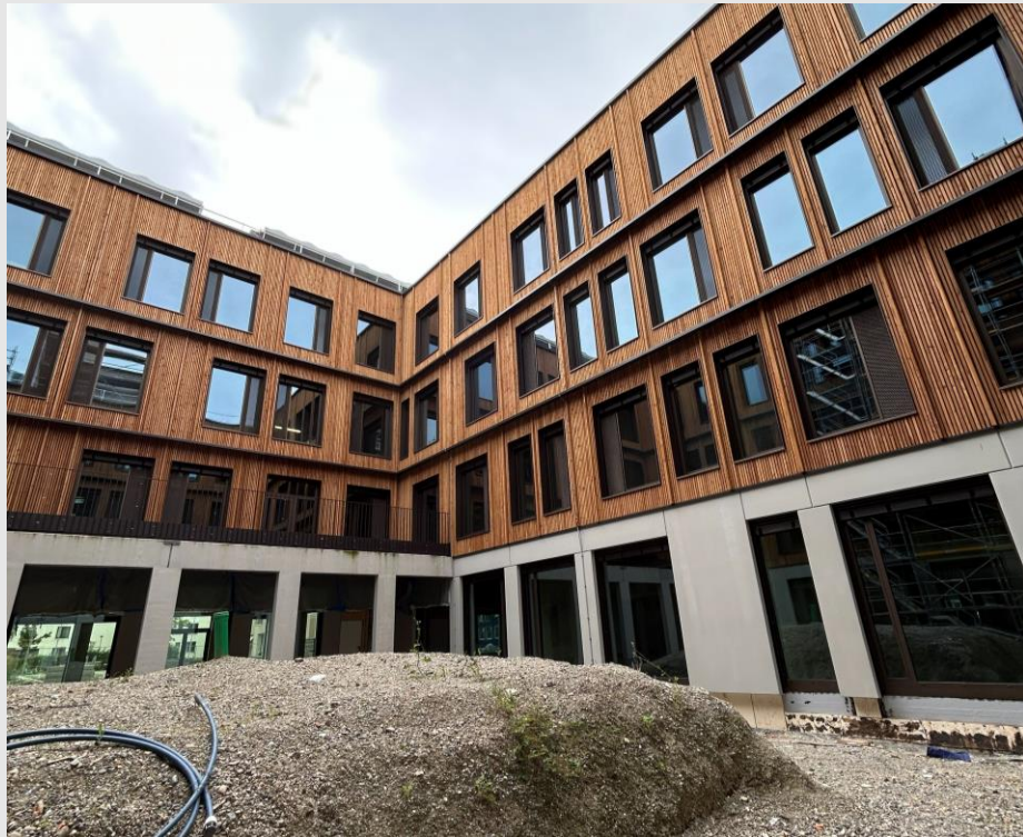
ZG: Blick in den Innenhof: Holzfassade ohne Gerüst