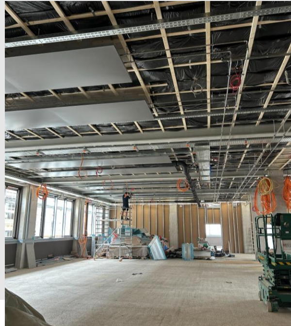
GT2: Montage abgehängte Decke