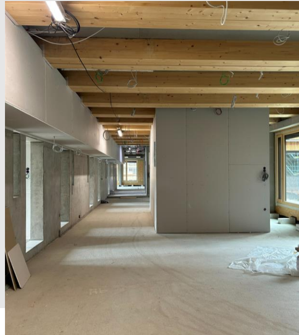
ZG: Ausbau, aktuell vor allem Trockenbau