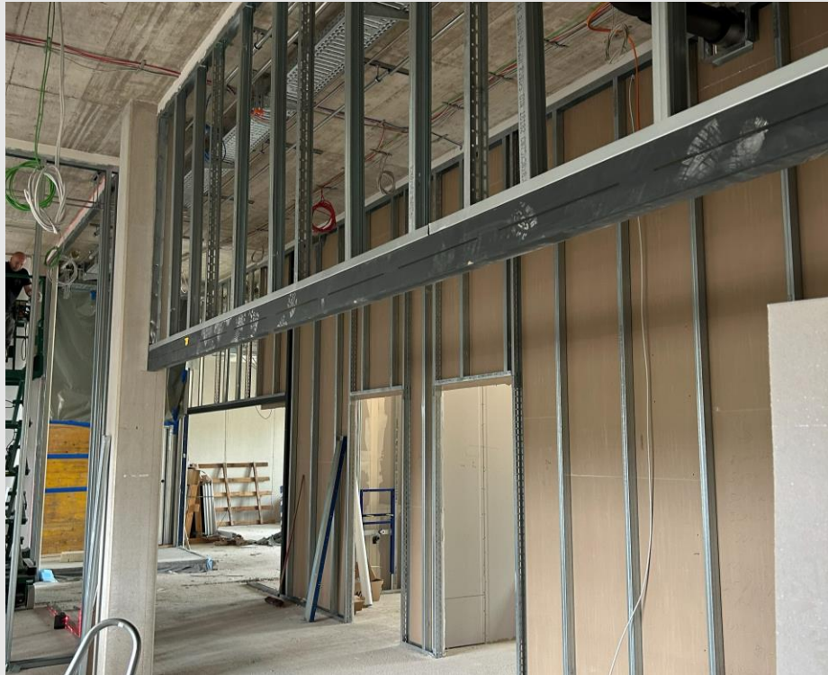
GT2: Stellen und beplanen von Trockenbauwänden